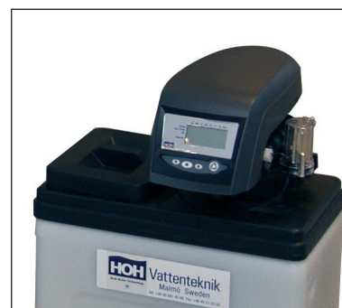
Automatiken kan vridas och monteras i tre olika lägen för bästa åtkomlighet.

Princess mjukvattenfilter är avsedda för hushåll och mindre industrier. Reducering av de hårdhetsbildande ämnena kalcium (Ca) och magnesium (Mg) leder till lägre energikostnader då varmvattenberedare skonas från igensättningar. Kalkfläckar på diskgodsets undviks och tvättmedelsförbrukningen minskar. Mjukvattenfiltren levereras även i specialutförande för reduktion av nitrat och humus.